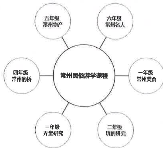
图2 清凉小学民俗游学课程框架