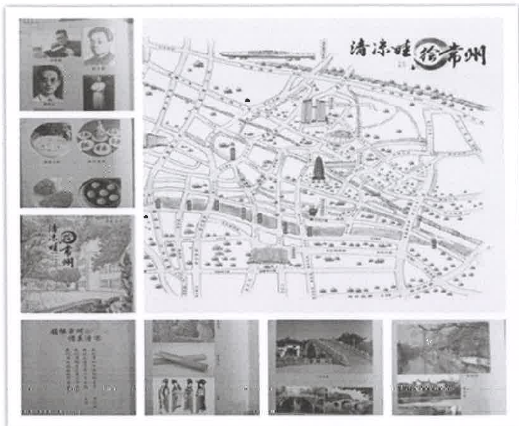
图 8 民俗游学地图